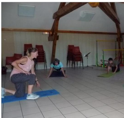
Les séances ont commencé ce mercredi.

Infos et inscriptions : 04 92 46 82 55 accueil.accssq@queyras.org