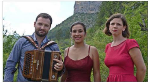
Les semeuses en concert au temple d'Arvioux le jeudi 13 décembre.

Le jeudi 13 décembre, l'ensemble de l'EMAGP sera en concert au temple d'Arvioux. Il jouera, à par-