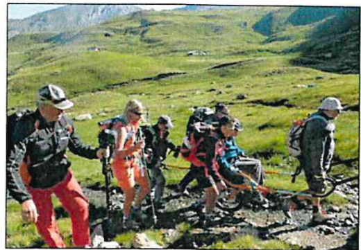
Le Tour du Guil aura lieu ce dimanche à partir de 7 h 45.

Une assurance personnelle est obligatoire. Prévoir également un équipement adapté aux conditions de haute mon-