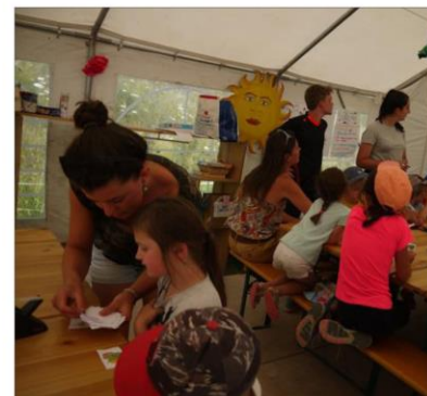
L'équipe d'animation lors d'une séance d'activité avec les enfants au centre de loisirs.