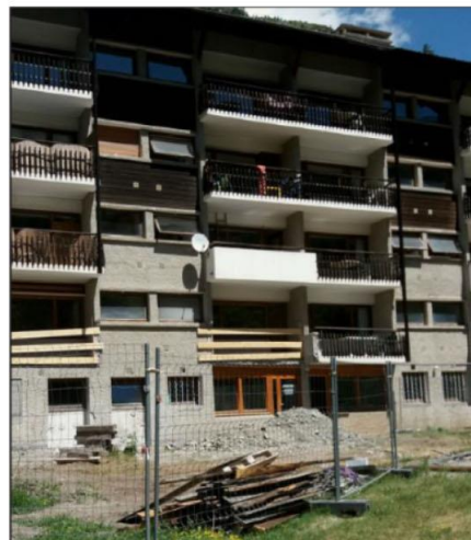
Les locaux, fermés depuis fin 2016, sont en travaux. Ils devraient être livrés au début du mois de janvier 2019.

professionnels, un espace Fablab, et une salle d'activités pour les habitants en général et les autres associations.