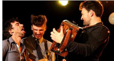
Le groupe italien Estremia a fait danser les "givrés".

Le premier bal givré de l'hiver a réuni une centaine de personnes. Elles n'ont pas hésité à braver le retour d'est en cours sur le fond de la vallée pour venir danser. Pour bien faire les choses, un atelier d'initiation aux danses folk a mis tout le monde dans le rythme. Les "givrés du Queyras" ont appris les pas qu'il fallait connaître pour entrer dans la danse. Il n'y avait plus d'excuses pour ne pas danser. Le groupe italien Estremia a continué sur la même lancée, avec une belle énergie. Pour terminer la soirée, Folk YoU a fini d'enflammer la salle. La soirée était organisée par l'ACSSQ, la FaceB-MJC du Briançonnais et Méléze Prod.