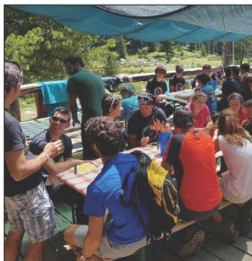
Un appel à projets destiné aux jeunes.

ACSSQ: 04 92 46 82 55. accueil.acssq@queyras.org.