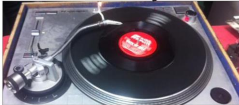
Rendez-vous à l'Ogival à partir de 20 h 30.

L'original Jah Militant aka Weeda Militant est de passage à l'Ogival. Il est accompa-