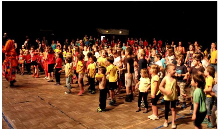
Les enfants, au travers d'œuvres musicales sur le thème de l'Afrique, sont montés sur scène pour interpréter des chansons.

Ce projet a permis de sensibiliser plus de 200 enfants du territoire du Guillemois-Queyras à l'oralité et à d'autres cultures.