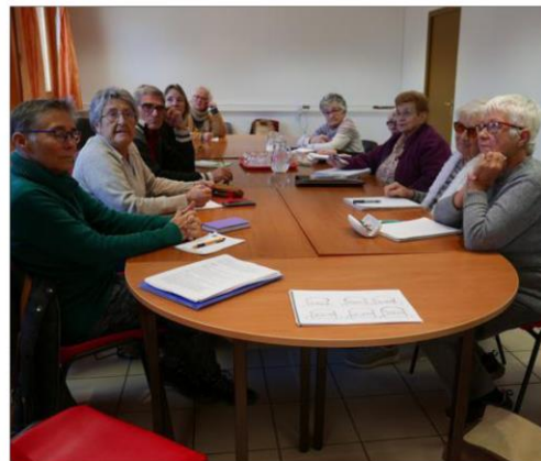
Des représentants de l'ACSSQ ont assisté à la séance hebdomadaire d'atelier-mémoire.

Ces personnes formées dernièrement par l'Université du temps libre d'Embrun (UTL) à ce type de séances de travail de la mémoire voulaient se rendre compte de comment l'association roteïrolle organisait ces ateliers, quels étaient leurs contenus, les exercices demandés aux participants, etc., avant de mettre en place des séances dans le Queyras.