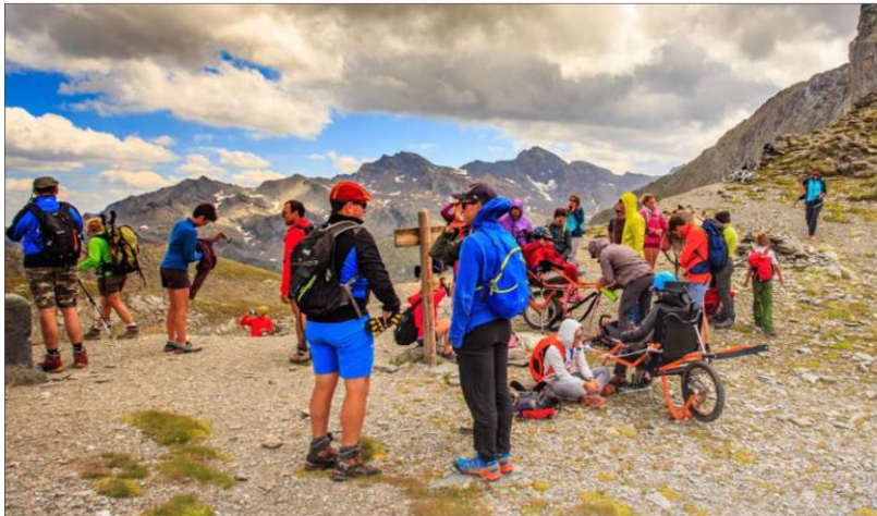
La journée "neige pour tous" a lieu mercredi.

Tous les ans, une journée "neige pour tous" est organisée par la commission handicap de l'ACSSQ et l'hôpital local d'Aiguilles. Tout le monde se retrouve pour passer une journée à la neige, et en ski.